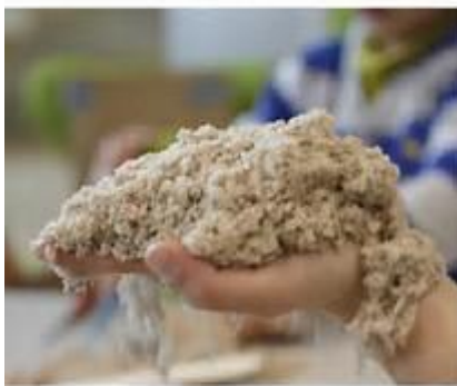
Enfant lançant du sable