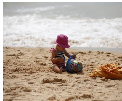
Enfant jouant seul sur la plage